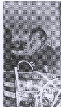
Due immagini del "popolo della notte"

Notte "Minimal", ovvero essenziale, ma ricca di eventi.